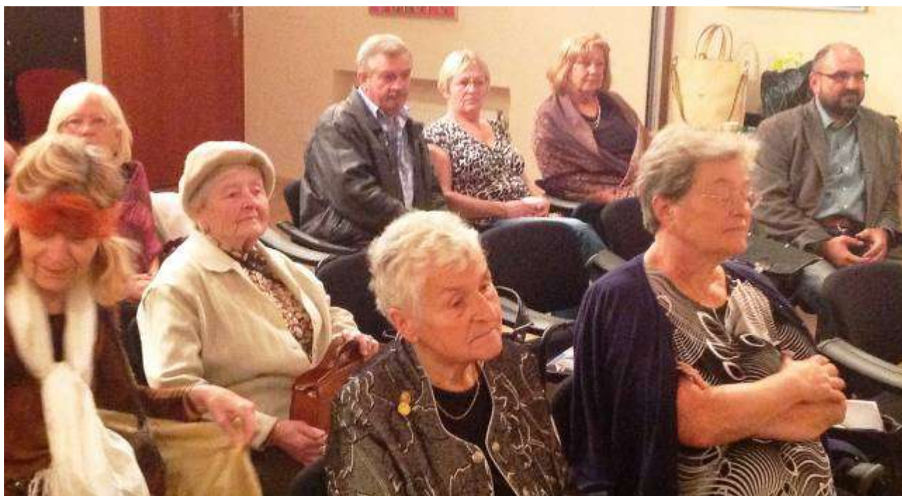
Pohled mezi delegáty XXI. Kongresu Panevropské unie Česko

Přes tuto lákavou nabídku jsou v úpadku, věří jim stále méně lidí a jejich neschopnost konsensu podrývá sám systém liberální demokracie- Občané jsou již unaveni z věčného hašteření, polopравd a lží, které se z politických stran hrnou. Jenže nikdo neví, jak ten cirkus nastavit. Přitom rozkrádání státu je ten nejmenší problém. Mnohem závažnější jsou důsledky pro morální zdraví národa a jeho připravenost zvládat nové a nové výzvy, které přicházejí z globalizovaného světa.